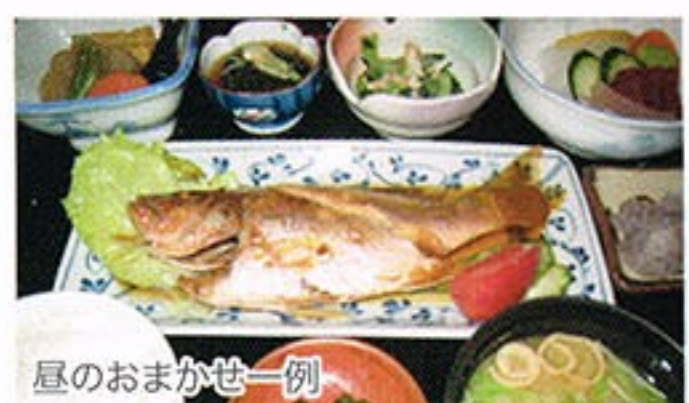
昼のおまかせ一例