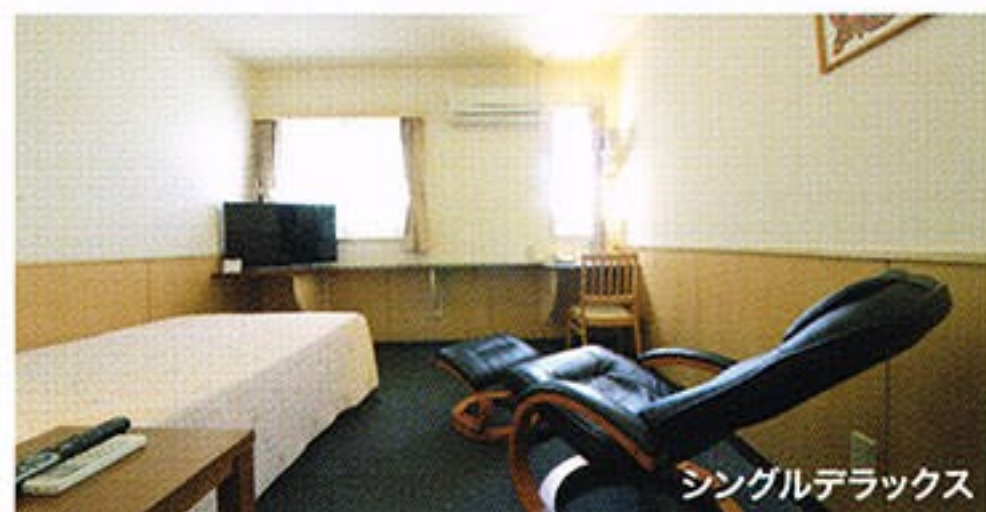
シングルデラックス