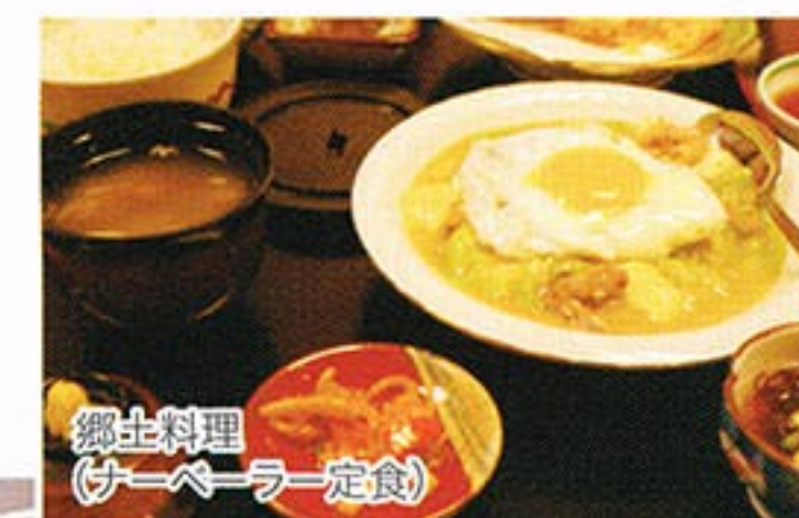
郷土料理 (サーベラー定食)